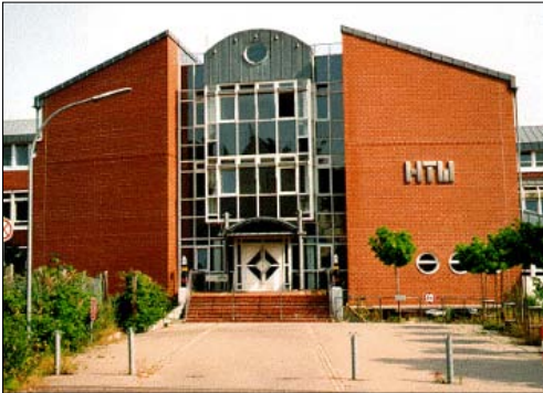
Gebäude der Hochschule für Technik und Wirtschaft des Saarlandes

Er hat die Professur für Informatik mit Schwerpunkt Wirtschaftsinformatik inne und ist gleichzeitig IT-Leiter der Fakultät Wirtschaftswissenschaften. Das ECM-System windream wird unter anderem auch in seinen Lehrveranstaltungen eingesetzt. Insgesamt nutzt die Fakultät bislang 60 windream-Lizenzen. Die Hochschule für Technik und Wirtschaft des Saarlandes gehört zu den forschungstärksten Fachhochschulen bundesweit. Ihr gehören circa 4000 Studierende an.